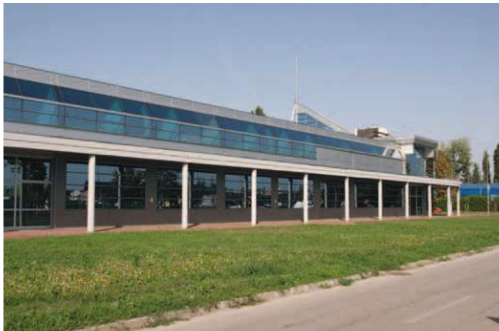
Nova autobuska stanica Put Novosadskog partizanskog odreda (2005)