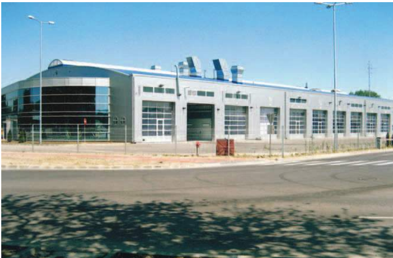
Servis za autobuse Put Novosadskog partizanskog odreda (2005)