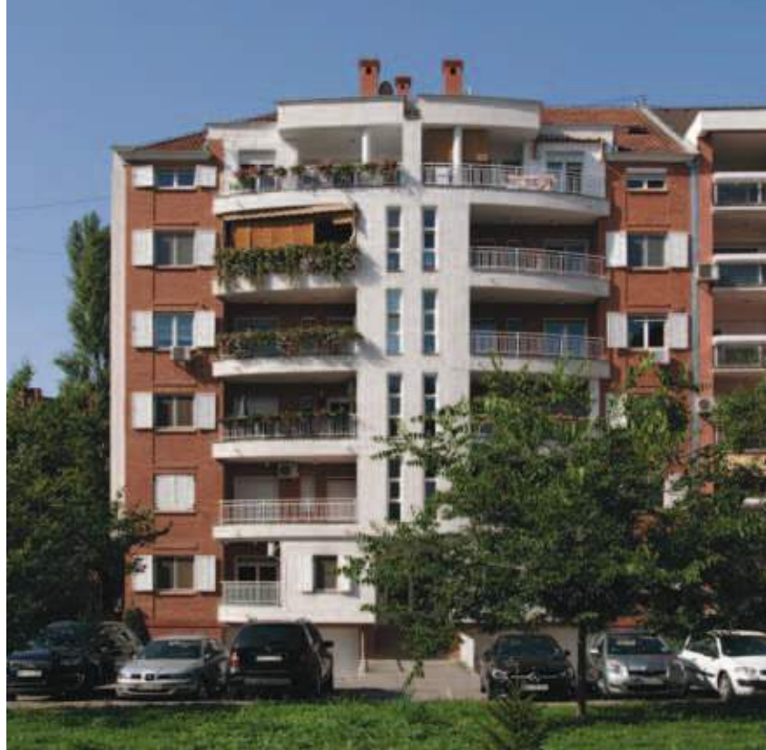
Stambeni objekat Vladislava Kaćanskog 34a (2001)

je uspešno sproveden prvobitni urbanistički plan naselja. Sami autori su u jednom novinskom intervjuu komentarisali svoj rad kao pokušaj stvaranja modela maksimalno prilagodljivog stana. Oni se odlučuju za taj koncept prilagodljivog stana u objektu koji je u celini prilagođen stanovniku i njegovim potrebama. Poenta je u nekoj vrsti prilagodljivog stanovanja u kome svaki pojedinačni stan, uz male prepravke, može dobiti još najmanje po pola sobe dok se funkcije pojedinih delova mogu razmeštati po svojoj volji. Za dnevni boravak, koji je najveći prostor i prirodna zajednička prostorija svih ukućana, autori su predložili u samom projektu devet varijanti preuređenja. Potom su sami stanari pronašli nove mogućnosti, te se svaki stan mogao urediti na dvadesetak načina čime je dobijao originalnost tradicionalnog porodičnog doma svake porodice po naosob. U samom projektu su bili predviđeni pokretni zidovi što na posletku izvođači nisu ispoštovali. Fleksibilnost stambenog