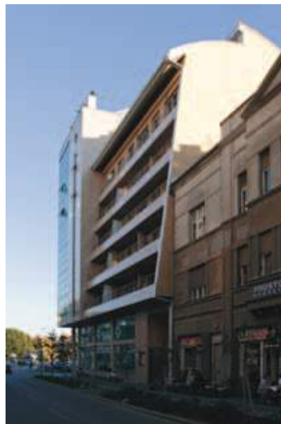
Stambeno-poslovni objekat Trg carice Milice (2006)

i kao takvi ostali upamćeni od strane građana, enterijeri kafića, koji se tih godina pojavljuje kao jedno novo središte društvenog i omladinskog života. Tako je ovaj segment rada arh. Cvetkova ostao, zajedno sa sociološkom pojavom kafića, plastično svedočio o vremenu „labudove pesme“ samoupravnog socijalizma krajem osamdesetih godina proteklog stoleća. Svoje enterijere Cvetkov je rado izlagao na godišnjim kolektivnim izložbama i salonima – Salon arhitekture (DaNS), FORMA (UPIDIV), Sremskomitrovački salon i Oktobarski salon Novog Sada.