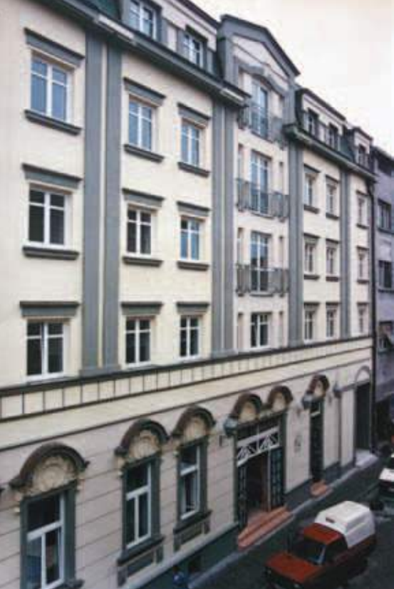
Stambeni objekat, nadogradnja nad postojećim prizemljem Nikolajevska 1 (1998)