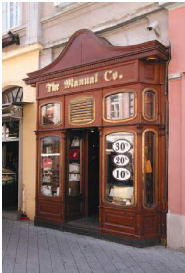
Butik "Manual Co" Dunavska ulica Enterijer