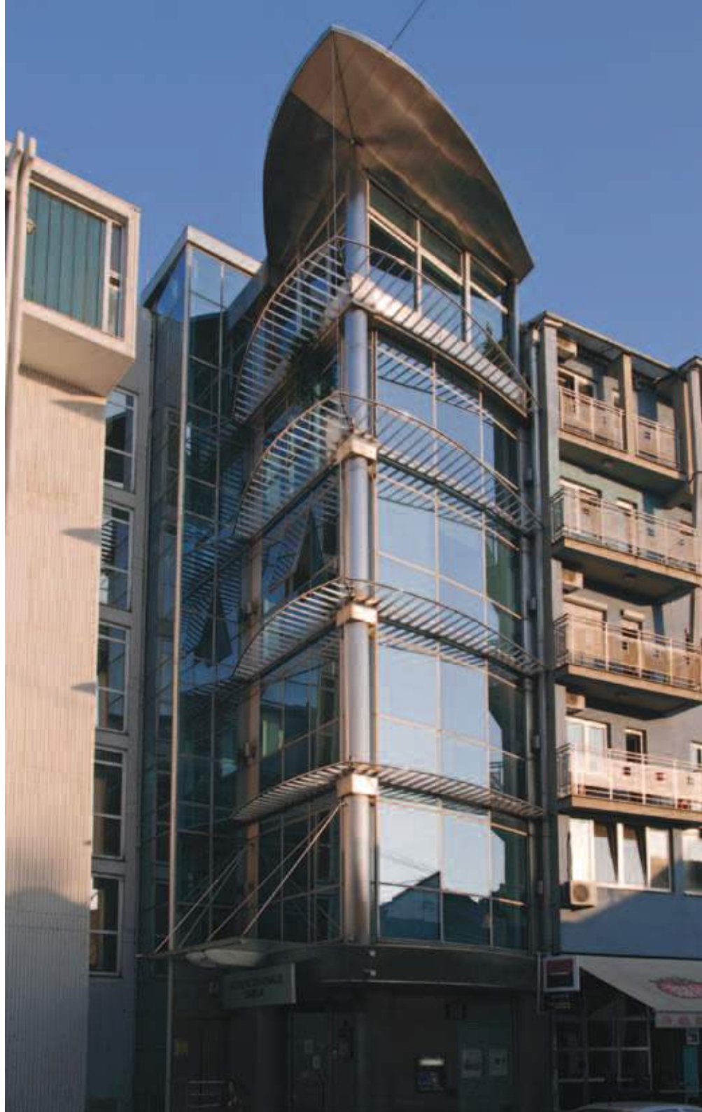
Poslovni objekat Železnička 7-9 (2000)