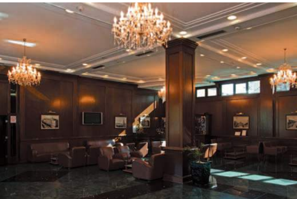
Hotel Novi Sad Enterijer