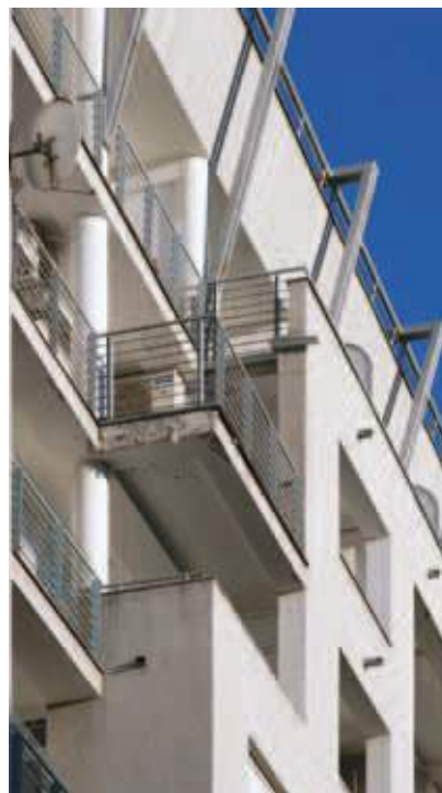
Poslovno-stambeni objekat sa tržnim centrom „Dalton“ ugao Bulevara Oslobođenja i ulice Laze Kostića (2003)