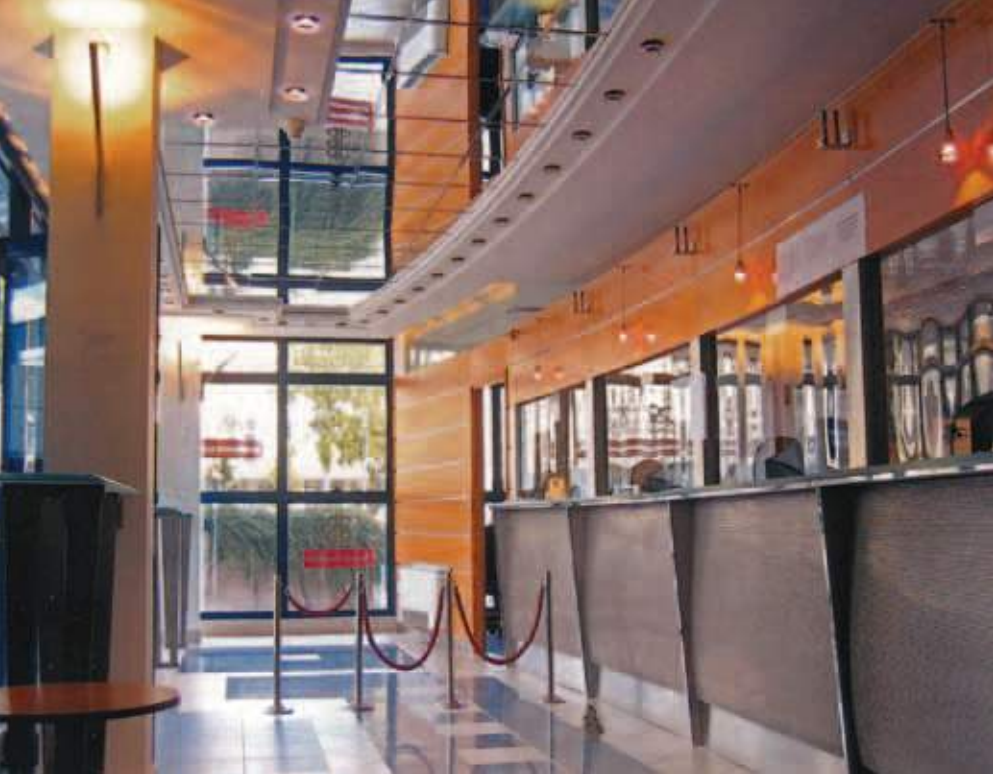
Šalter sala Vojvođanske banke u zgradi NIS Enterijer