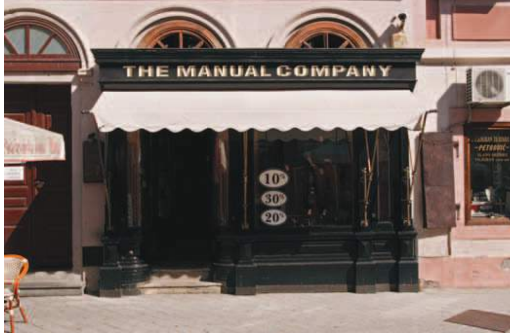
Butik "Manual Co" Dunavska ulica Enterijer